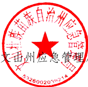
文山州应急管理局