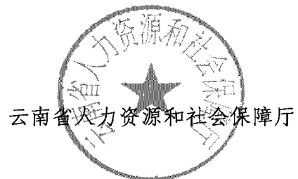
云南省人力资源和社会保障厅