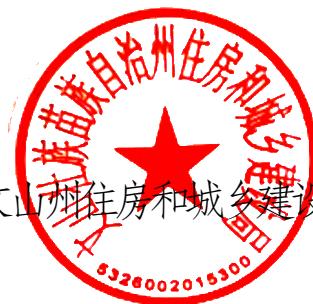
文山州住房和城乡建设局