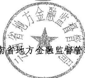
云南省地方金融监督管理局