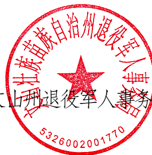
文山州退役军人事务局