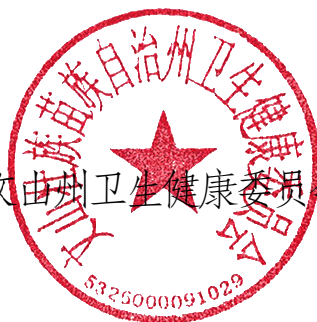
文山州卫生健康委员会