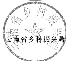
云南省乡村振兴局