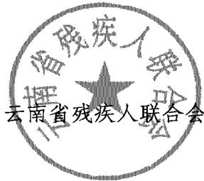
云南省残疾人联合会