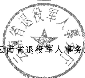
云南省退役军人事务厅