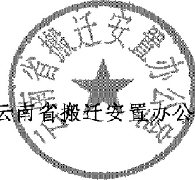
云南省搬迁安置办公室