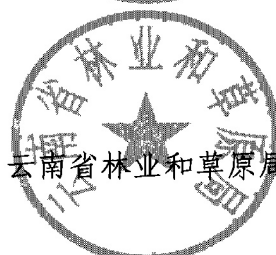
云南省林业和草原局