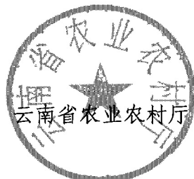
云南省农业农村厅