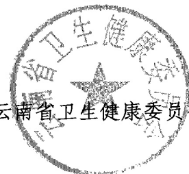
云南省卫生健康委员会