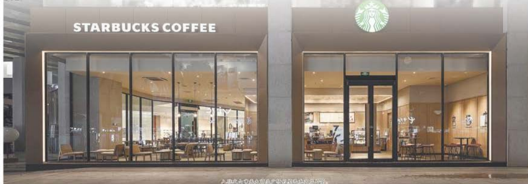
文山首家星巴克门店入驻光大商业广场。