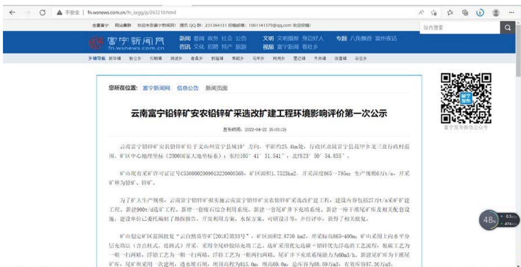
图 2-3 环境影响评价第一次网站公示（富宁新闻网）