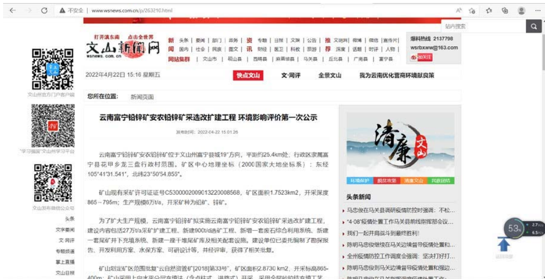
图 2-2 环境影响评价第一次网站公示（文山新闻网）