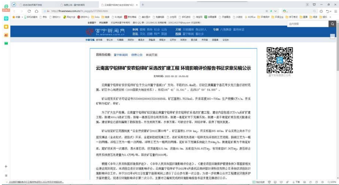
图 3-1 征求意见稿网上公示截图

项目环评征求意见稿在富宁新闻网网站上公示，符合要求。网址： http://fn.wsnews.com.cn/fn_xxgg/p/272566.html 。