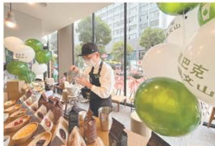
工作人员正在制作饮品。