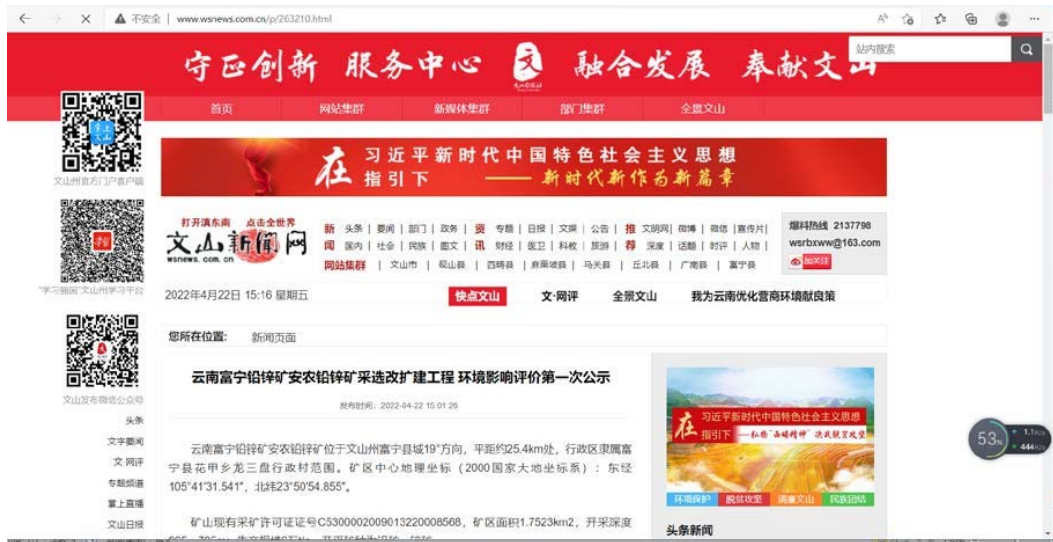
图 2-1 环境影响评价第一次网站公示