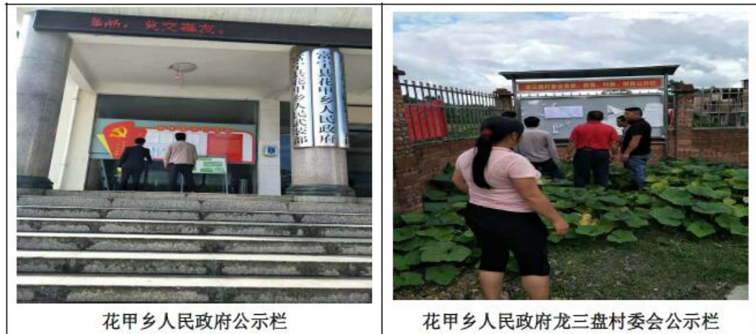
图 3-4 公告栏-张贴征求意见稿公示

我矿在花甲乡和龙三盘村委会公告栏张贴了公众参与公告,对项目环境影响报告书征求意见稿进行公示,公示时间为2022年9月8日~9月23日。