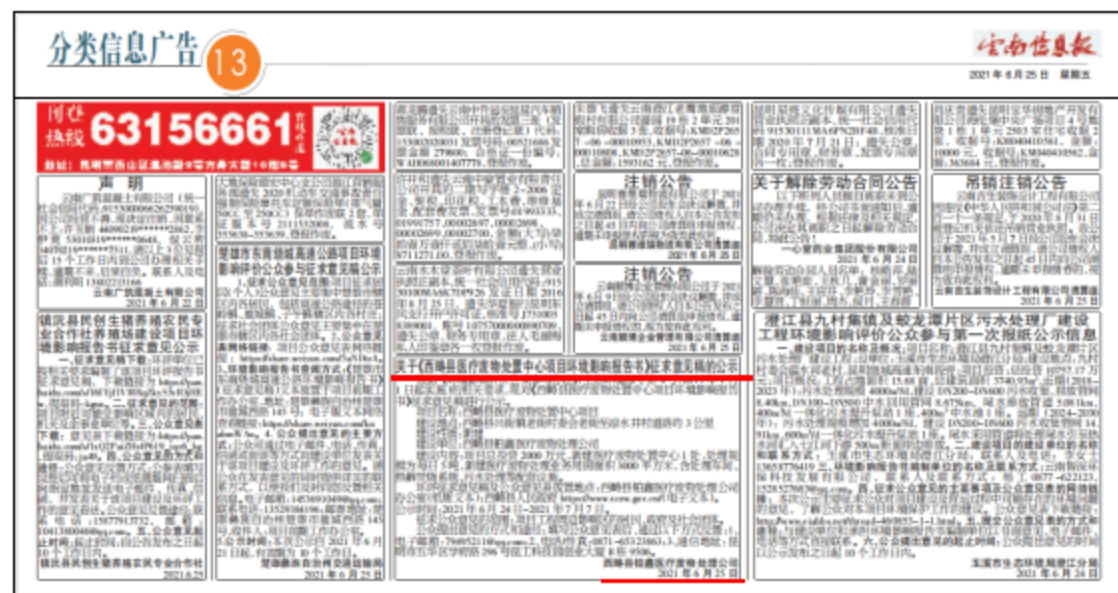
图6 2021年6月25日在云南信息报第二次报纸公示图片