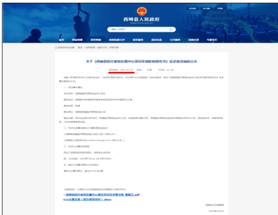
图2 征求意见稿网络公示截图(2021年7月1日)