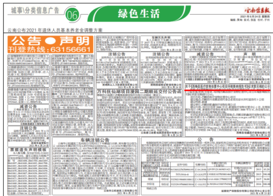
图5 2021年6月24日在云南信息报第一次报纸公示图片

我单位在征求意见稿期间①于2021年6月24日和2021年6月25日在《云南信息报》上进行了征求意见稿信息公开；②于2021年11月5日-11月18日期间的2021年11月15日、11月18日再次在《文山日报》上进行了征求意见稿信息公开。报纸公示图片如下：