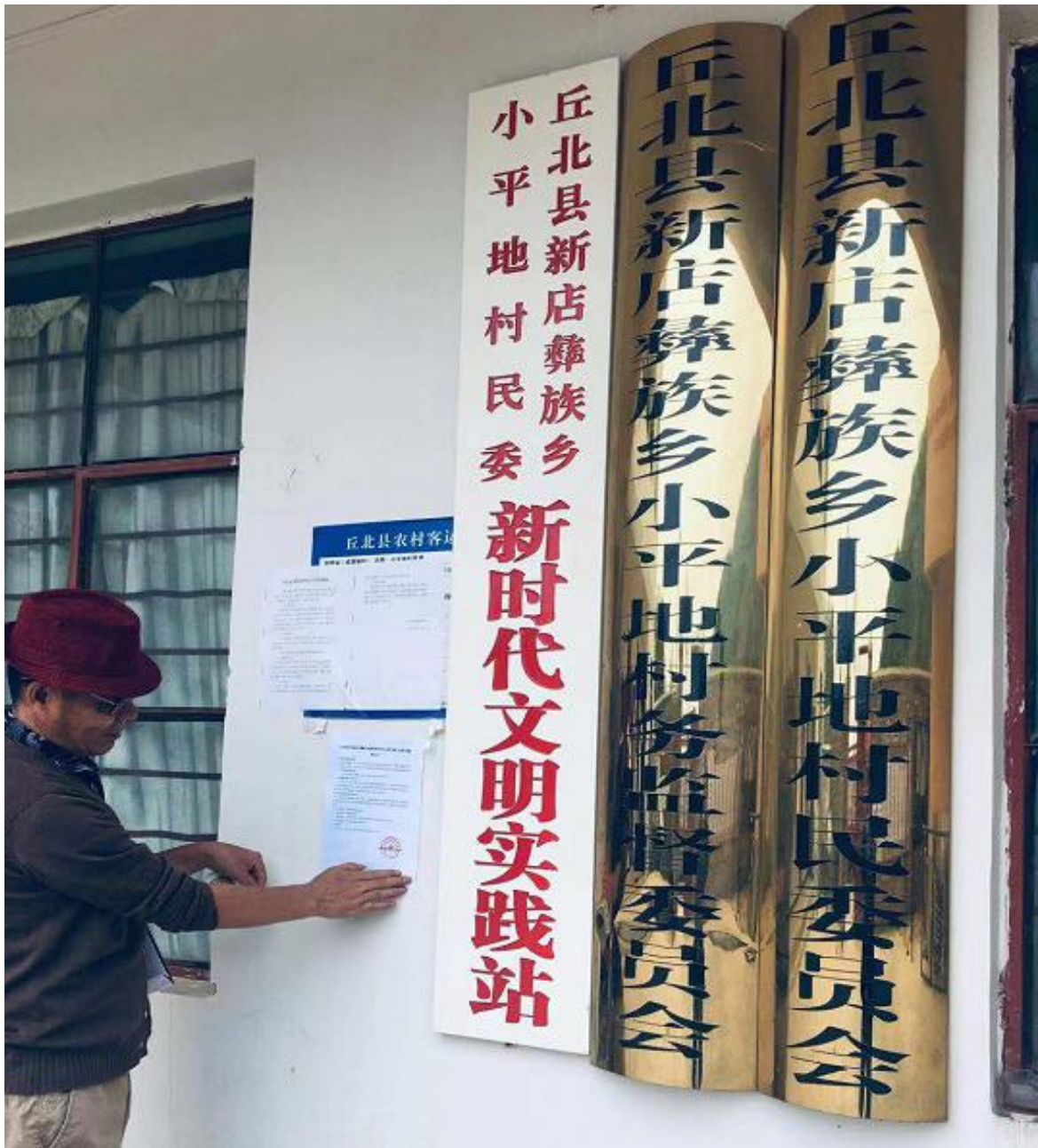
小平地村村委会现场公示照片