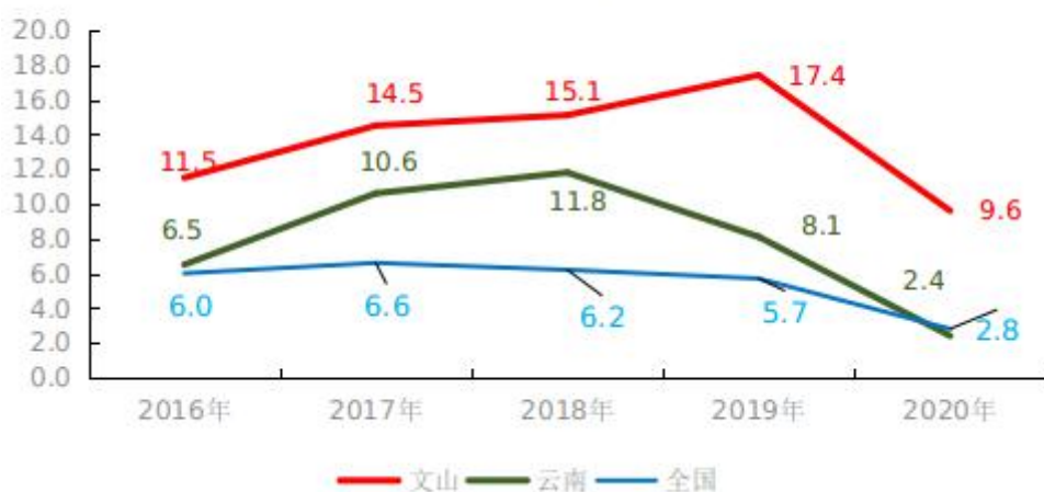
“十三五”期间文山州与全国、全省规模以上工业增加值增速对比（%）