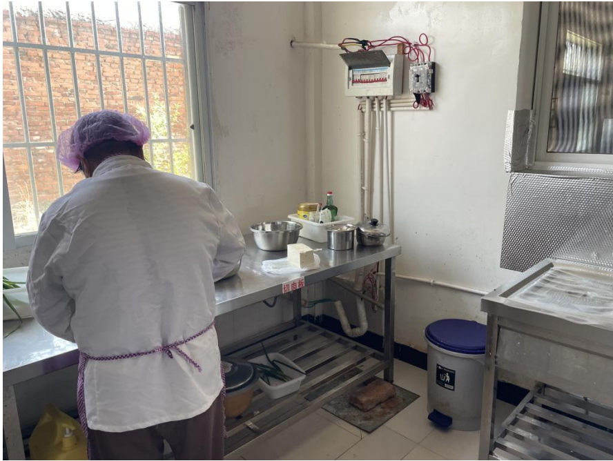
图为服务部分现场核查