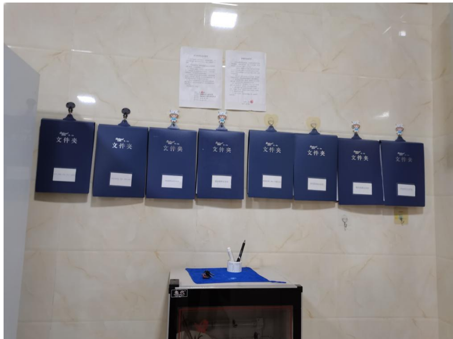
图为服务记录审查