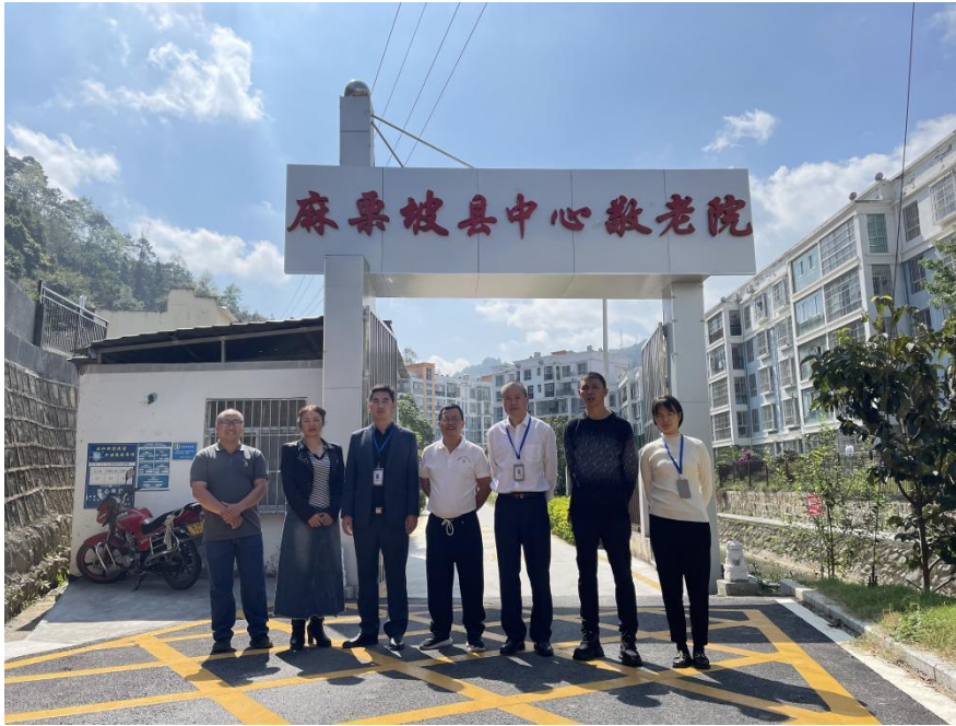
图为评定现场合影