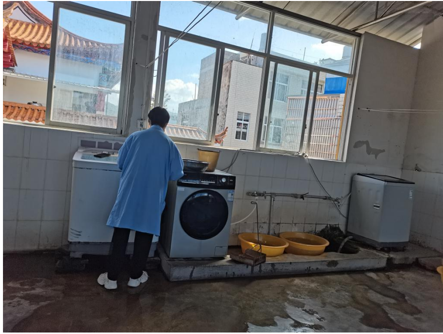
图为环境与设施设备现场审查