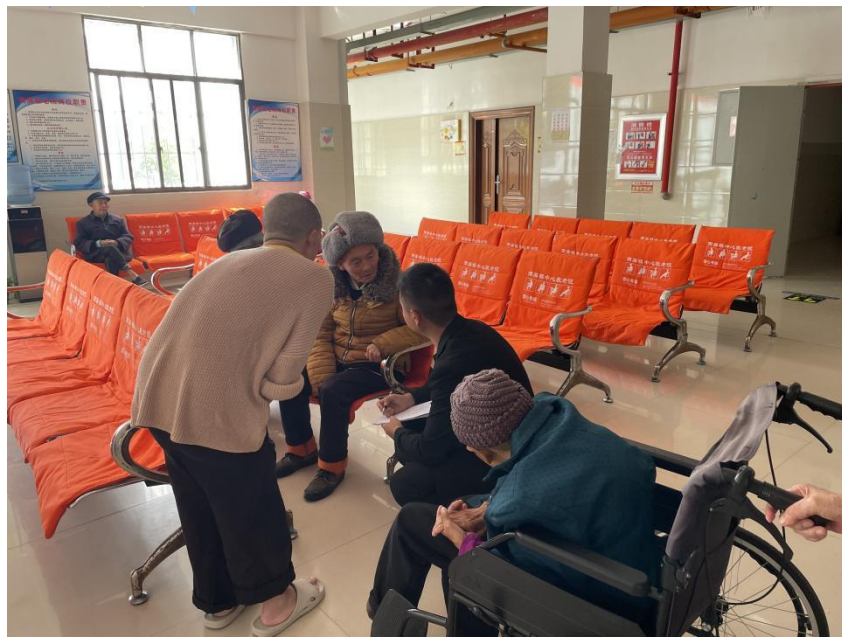
图为老年人满意度调查