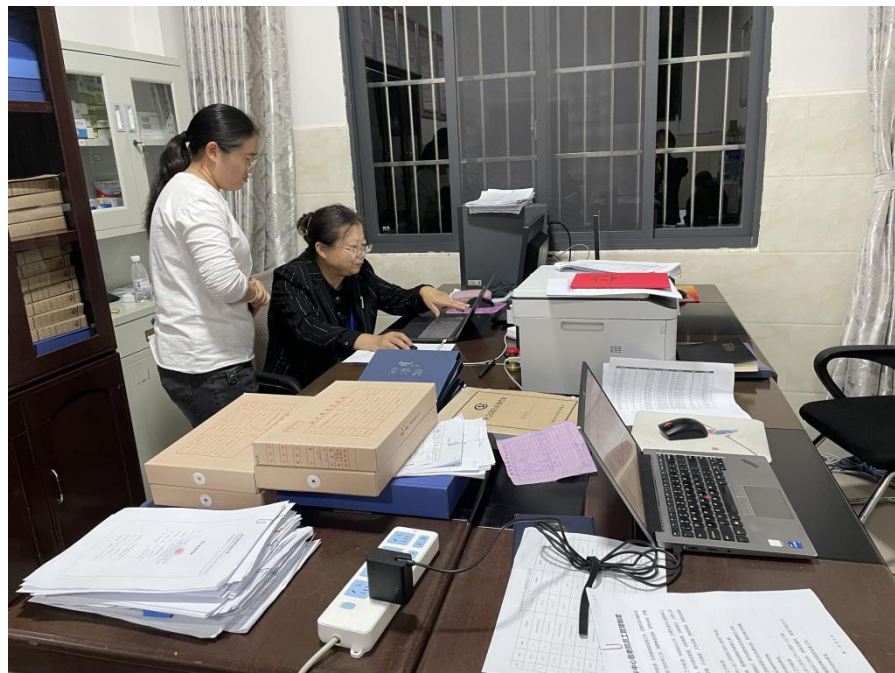
图为运营管理现场核查