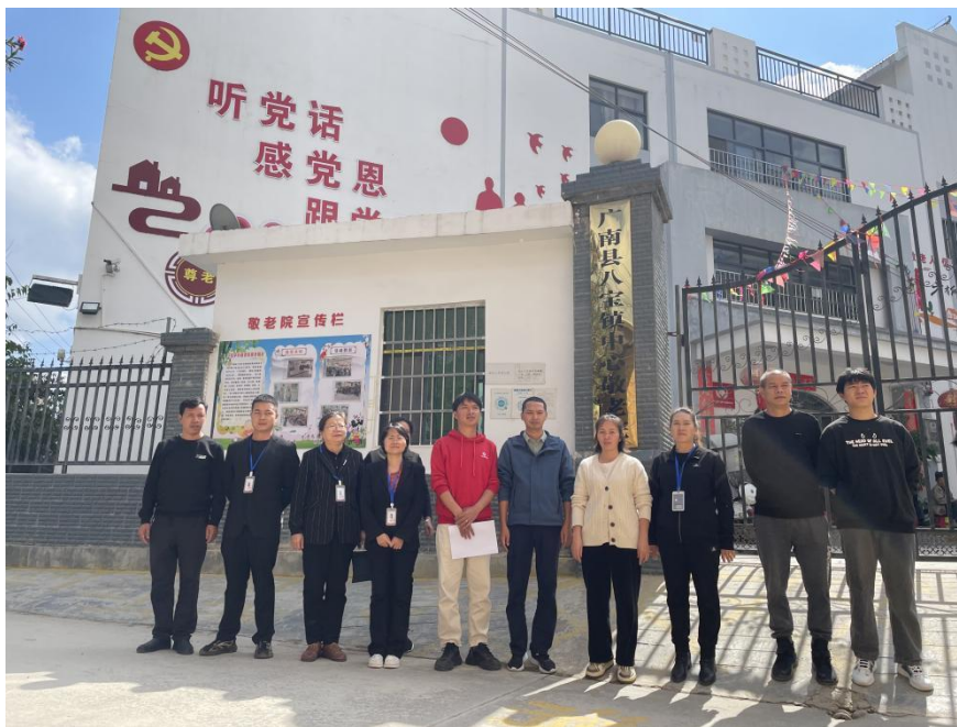
图为评定现场合影