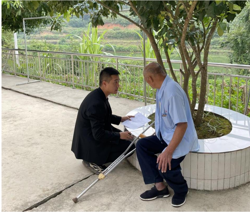
图为老年人满意度调查