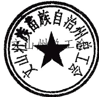
文山州工业和信息化局