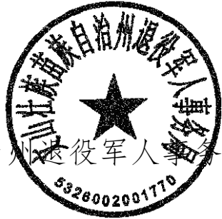
文山州退役军人事务局