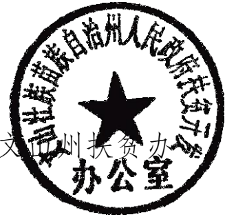
文山州扶贫开发办公室