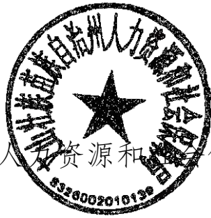
文山州人力资源和社会保障局