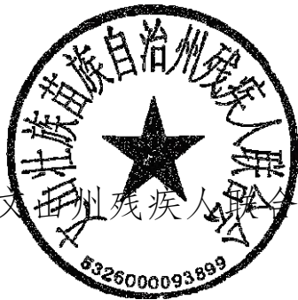
文山州残疾人联合会